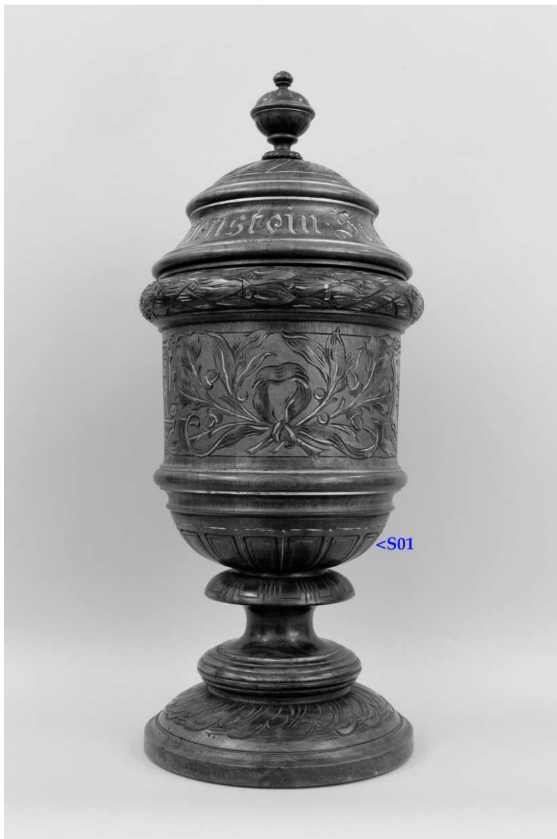
Umístění zkoušky snímání prachových depositů a ztmavlých laků