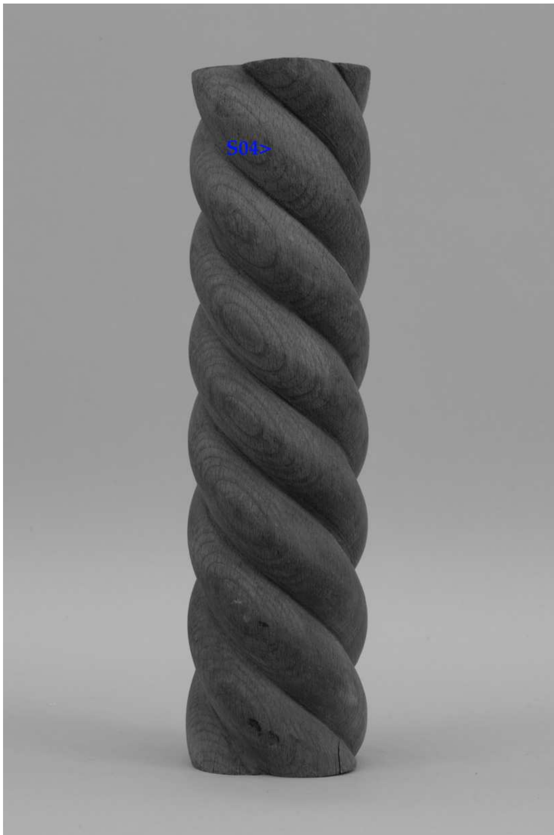
Umístění zkoušky snímání prachových depositů a ztmavlých laků