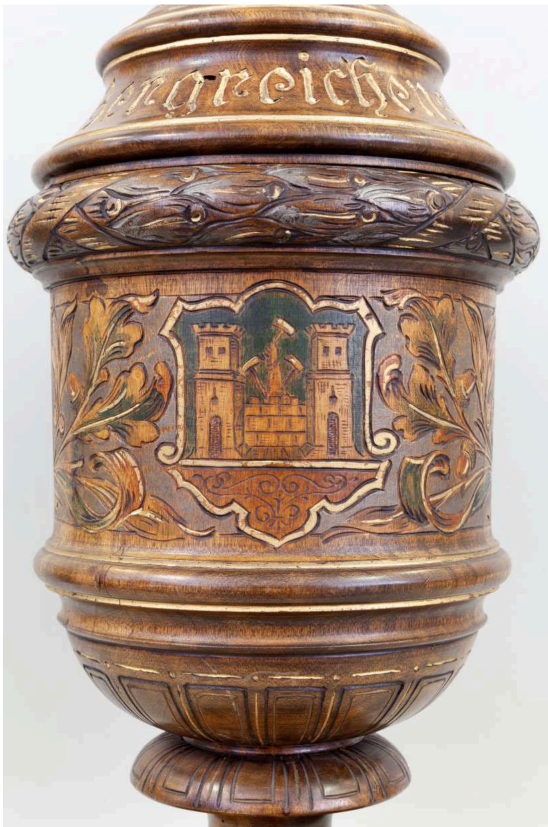
Stav před restaurováním - Pohár - detail městského znaku