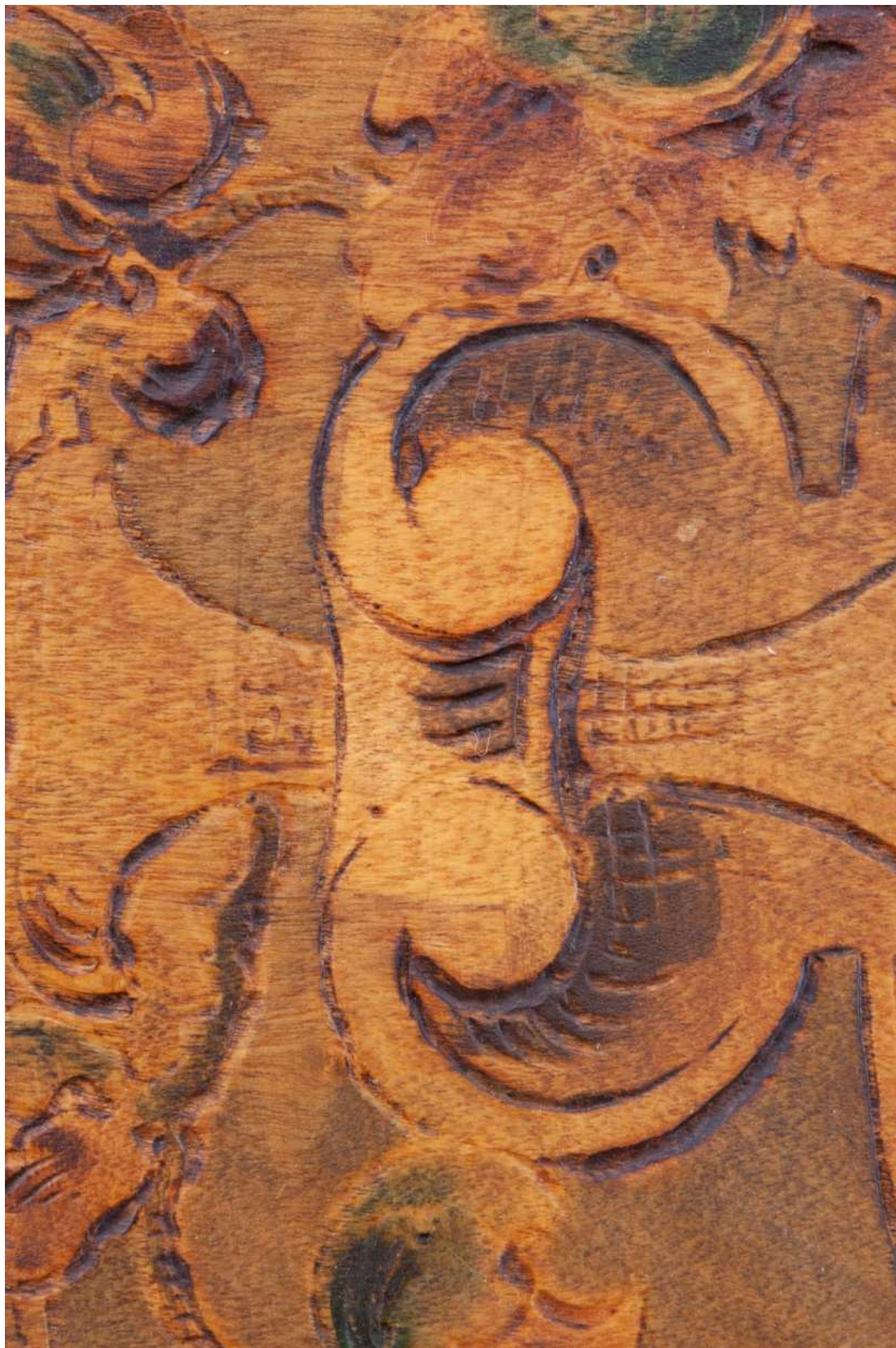
S02 - zkouška snímání prach. depositů a ztm. laků - Talíř