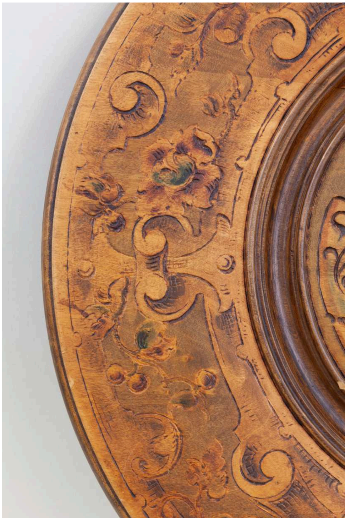
Stav před restaurováním - Talíř - detail pásu