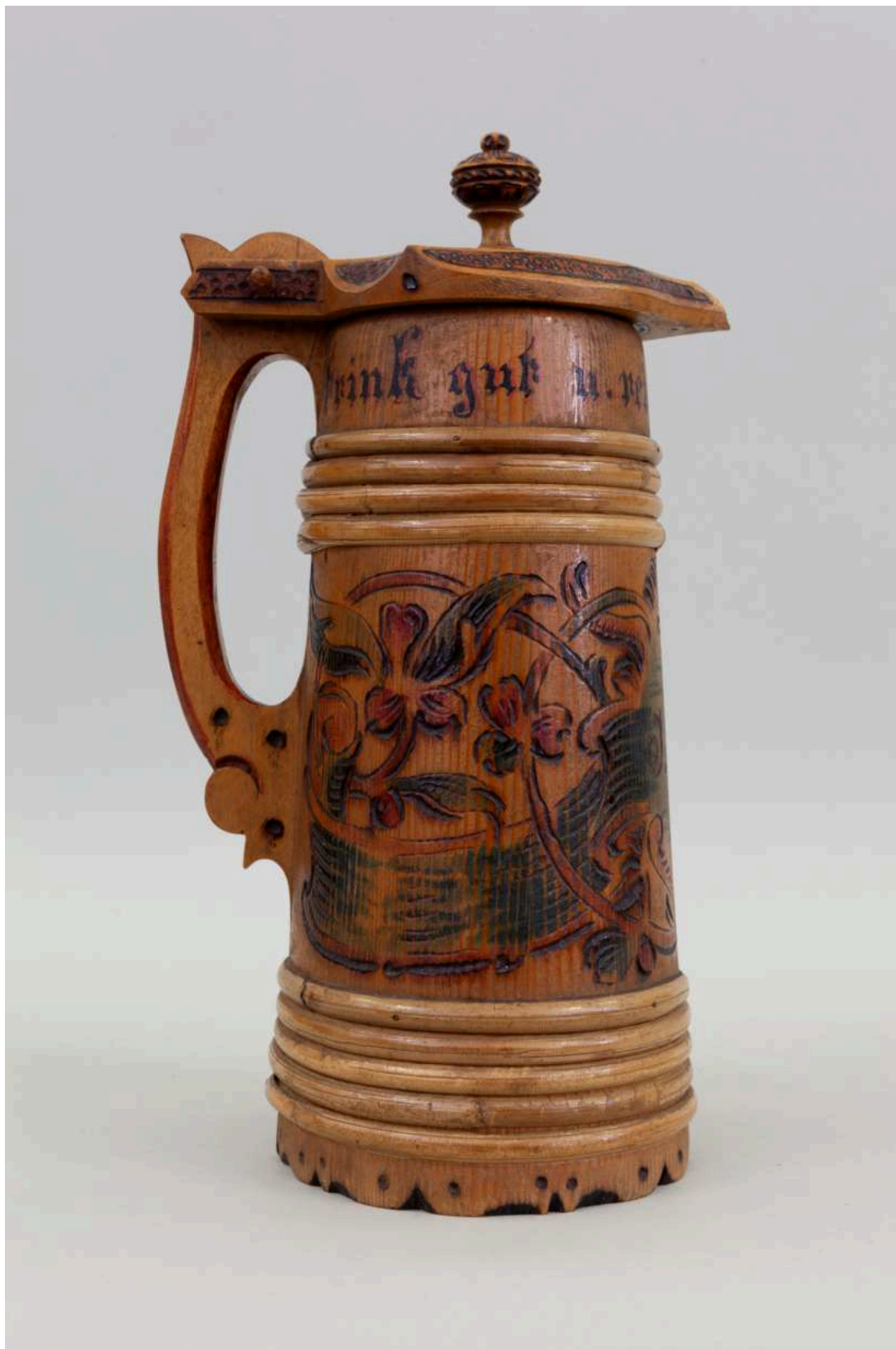
Stav před restaurováním - Holba - celkový pohled