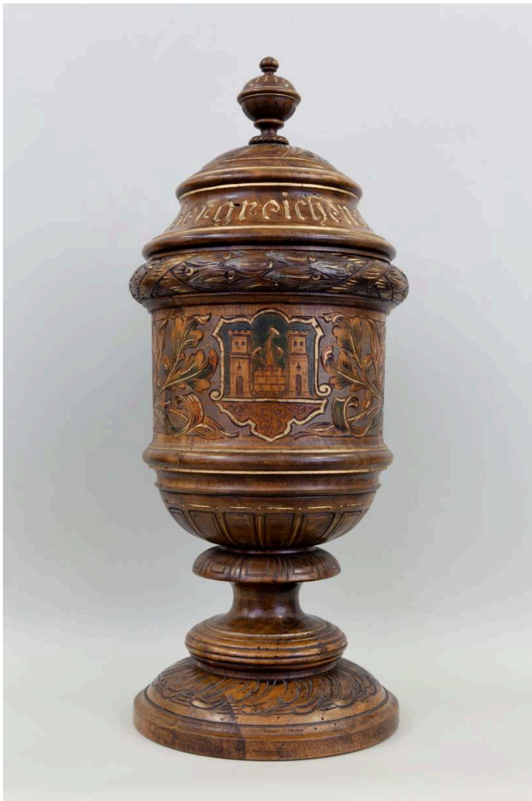
Stav před restaurováním - Pohár - celkový pohled