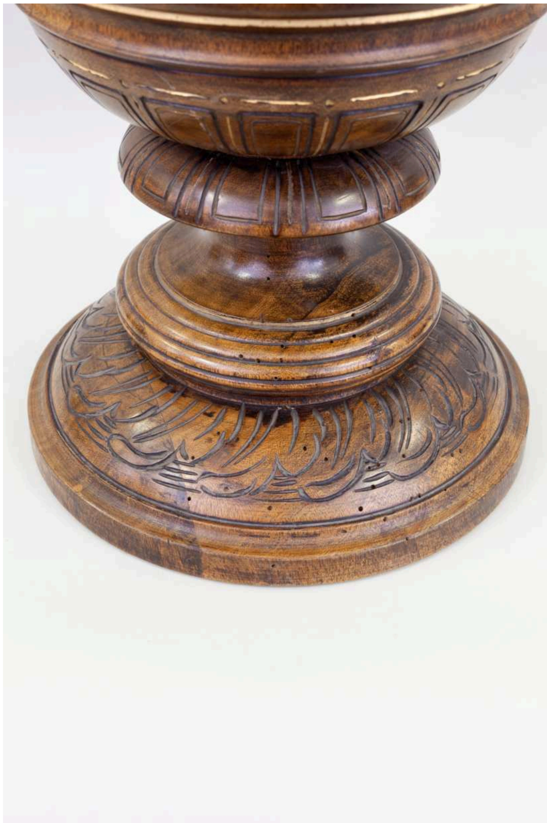
Stav před restaurováním - Pohár - detail poškození