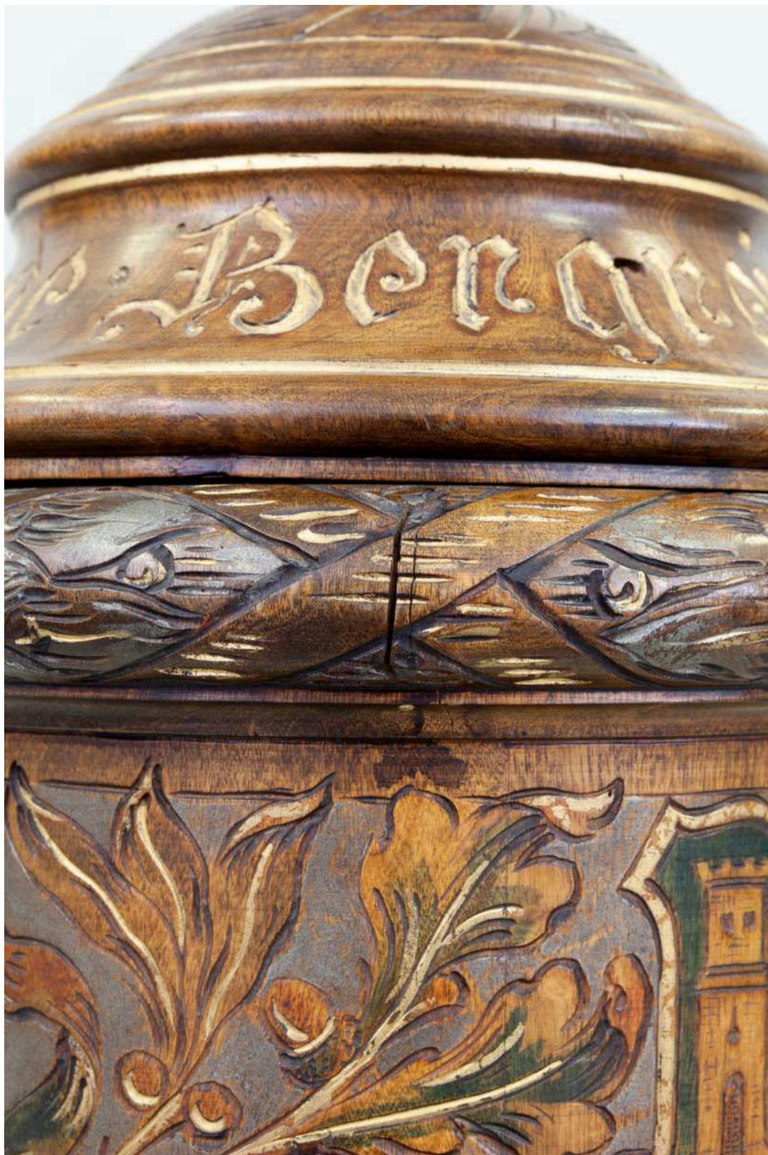
Stav před restaurováním - Pohár - detail poškození