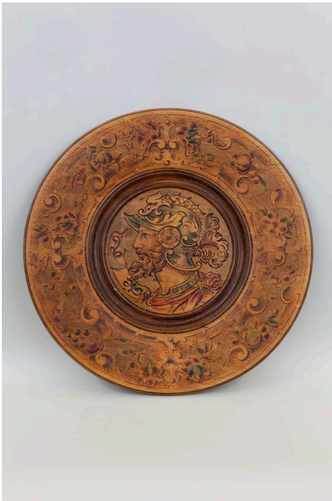
Stav před restaurováním - Talíř - celkový pohled