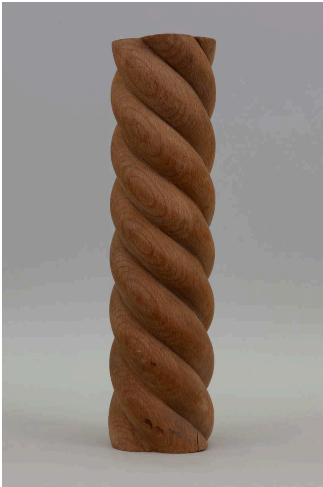
Stav před restaurováním - Sloupek - celkový pohled