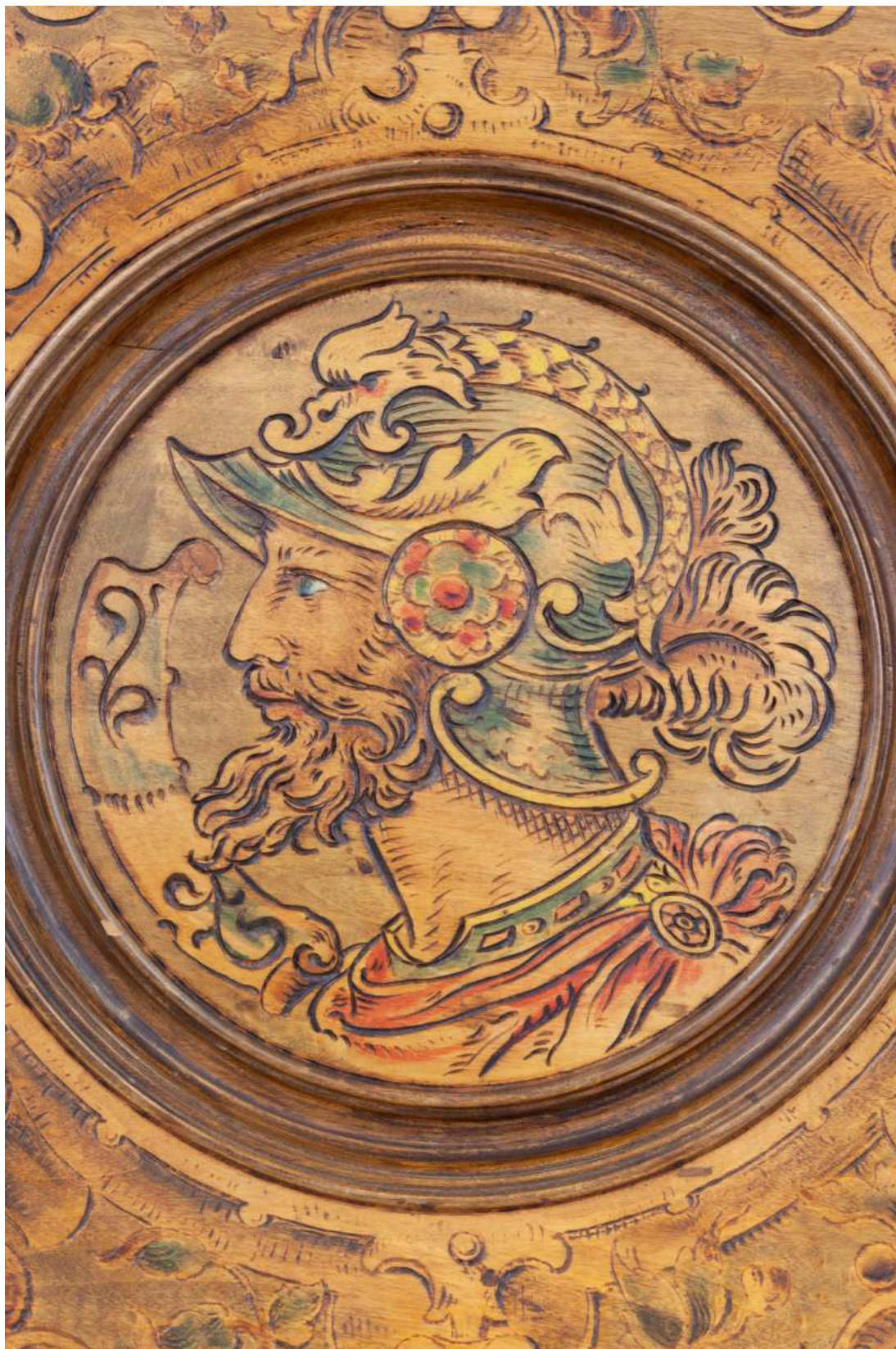
Stav před restaurováním - Talíř - detail středu