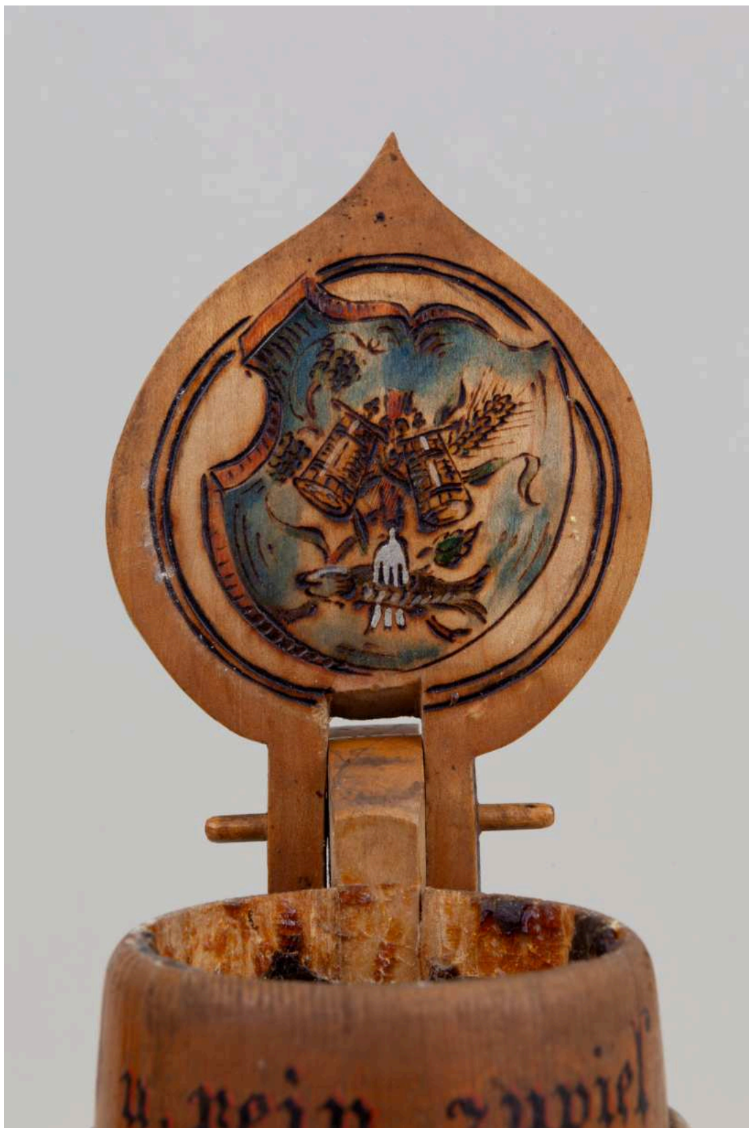
Stav před restaurováním - Holba - detail víčka