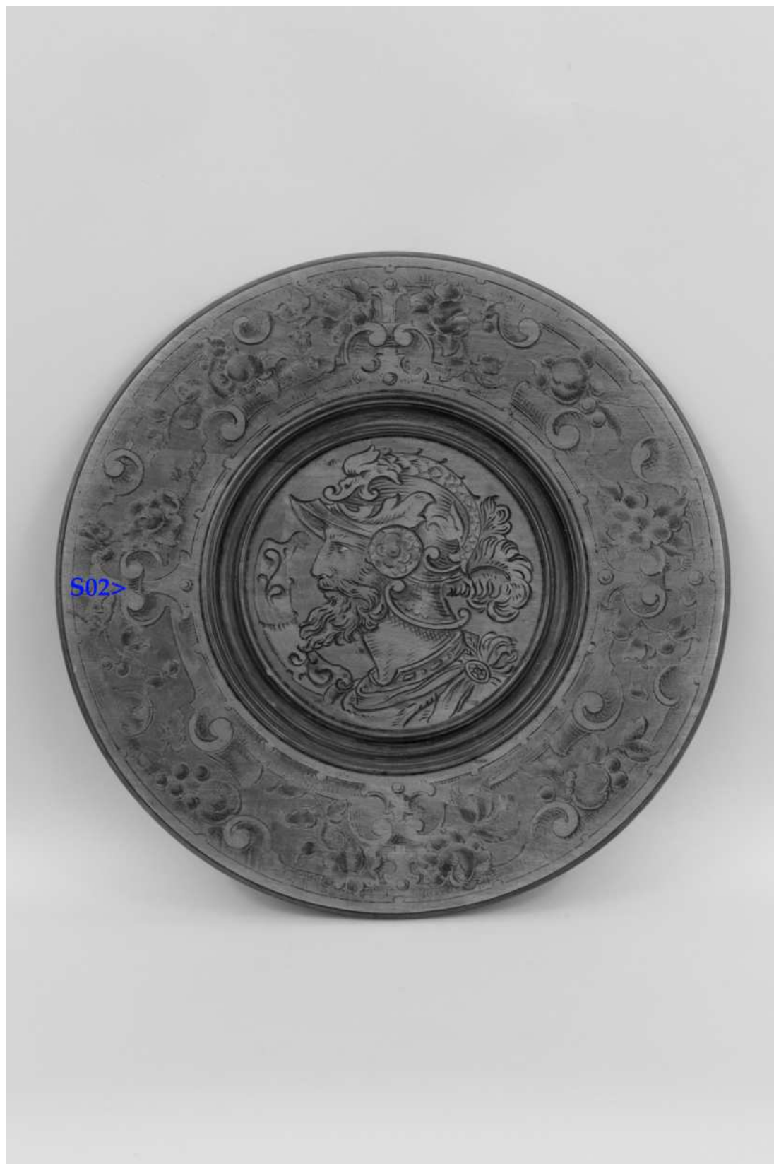
Umístění zkoušky snímání prachových depositů a ztmavlých laků