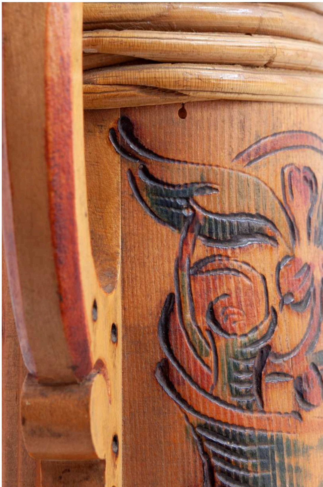
S03 - zkouška snímání pracho. depositů a ztmavlých laků - Holba