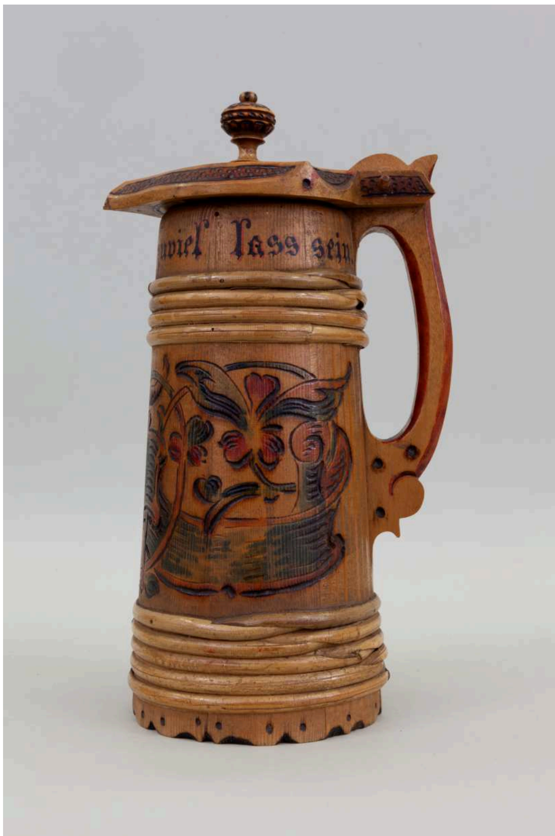
Stav před restaurováním - Holba - celkový pohled