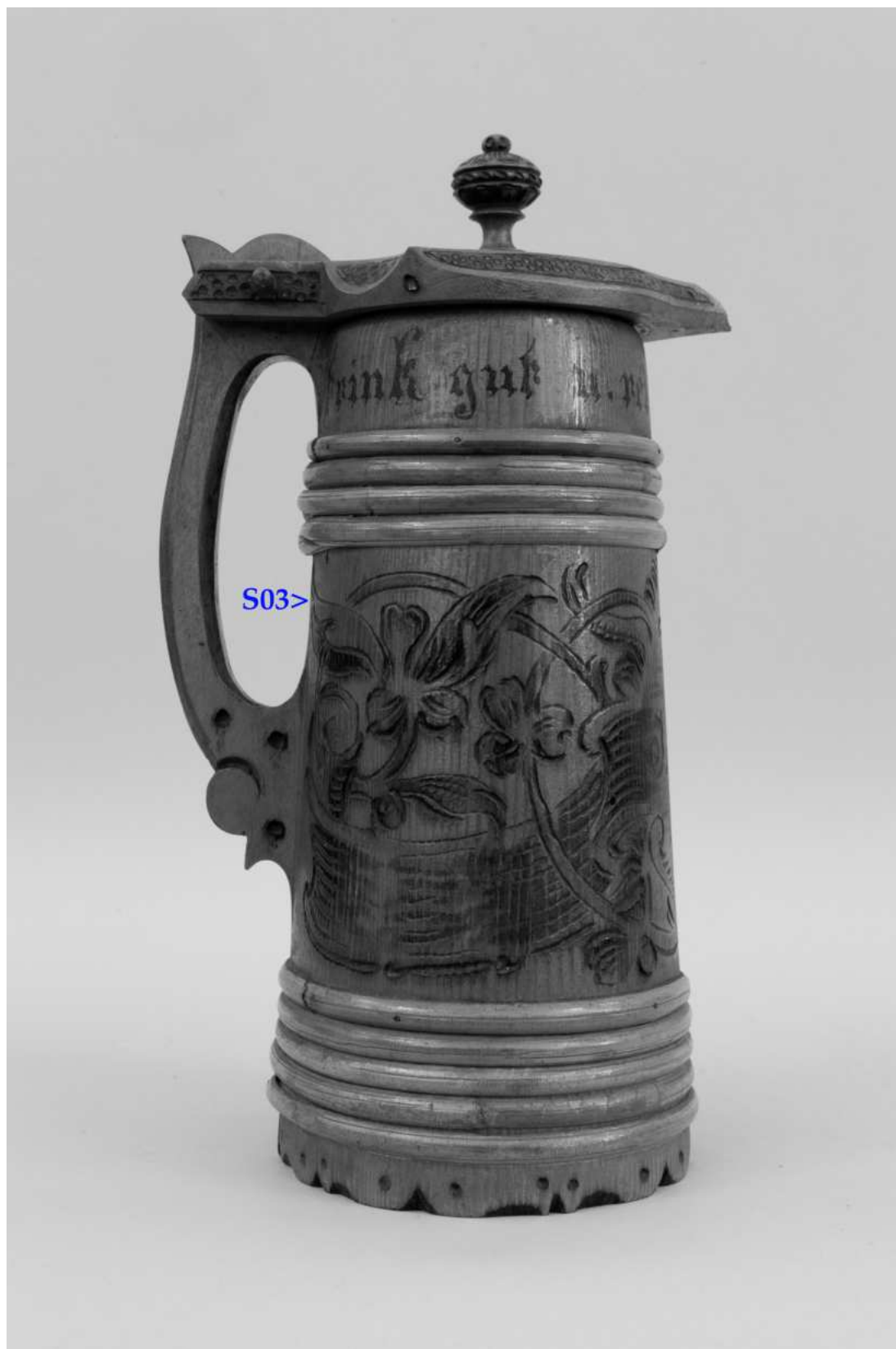
Umístění zkoušky snímání prachových depositů a ztmavlých laků